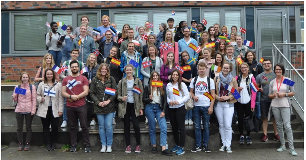
Foto: Erasmus Outgoing Students 2018/19

Die Koordinator*innen wählen die Studierenden, die sie entsenden, aus. Die Bewilligung der Bewerbungen und Zuteilung der Plätze erfolgt auf Basis der bisher erbrachten Leistungen und der Motivation.